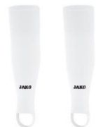
JAKO Stutzen Glasgow 2.0 4,19 €