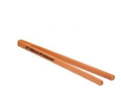
Grillzange Fire 10,95 €