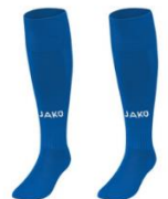
JAKO Stutzenstrumpf Glasgow 2.0 5,99 €