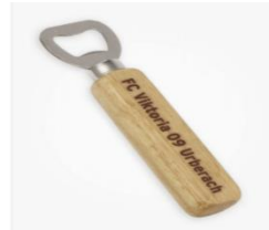
Flaschenöffner Zisch 9,95 €