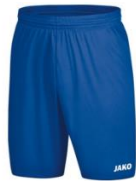
JAKO Sporthose Manchester 2.0 ohne Innenslip ab 8,39 €