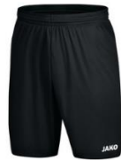
JAKO Sporthose Manchester 2.0 ohne Innenslip ab 8,39 €