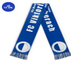
FC Viktoria Urberach Fanschal 19,95 €