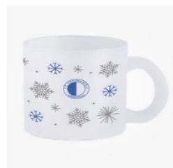
Glühweintasse Lüli 14,95 €