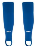
JAKO Stutzen Glasgow 2.0 4,19 €