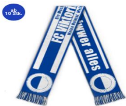
Fanschal FC Urberach 19,95 €

Unseren Fan-Shop erreicht ihr unter der Adresse www.fcurberach.fan12.de .