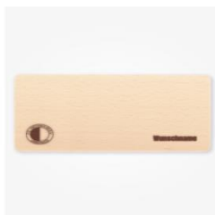
Frühstücksbrett Bernd 14,95 €