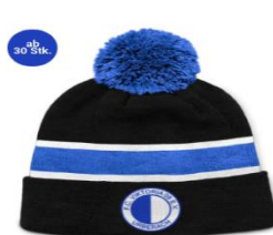
Bommelmütze 24,95 €