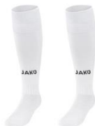
JAKO Stutzenstrumpf Glasgow 2.0 5,99 €