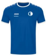
JAKO Trikot Primera Kurzarm ab 15,99 €

Zu dem Shop gelangen Sie über unsere Homepage, www.fcurberach.de → Viktoria Shop → Logo JAKO TeamShop , über den obigen Link oder scannen des QR-Codes: