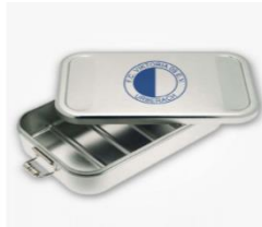
Brottdose Logo 19,95 €