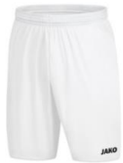
JAKO Sporthose Manchester 2.0 ohne Innenslip ab 8,39 €